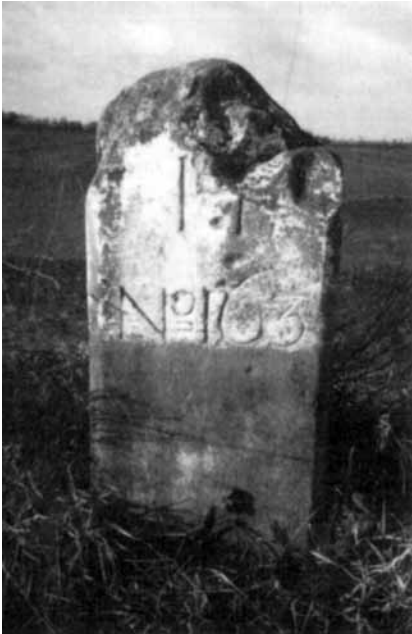
Grenspaal 163.

Dit vermeende recht op het Zwarte Meer werd door de raad van State der Republiek van de hand gewezen in een brief van 15 februari 1740 aan Drost en Gedeputeerde Staten.