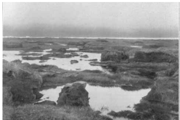
Slecht toegankelijk moerasgebied (bron; Emsländische Moorkolonien, H. Blanke, 1938).

"Het is interessant om te weten wat zich hier heeft afgespeeld. Het is niet zeker dat de beide moorden daar hebben plaatsgevonden. Het is niet onwaarschijnlijk dat de doodslag ergens anders is gebeurd en de lijken bij de berg zijn neergelegd. Volgens oud-Germaans geloof werden vermoorde personen bij voorkeur bij een kruising waar vier dorpen of stamgebieden samenkwamen, verstopt. Dan kon de geest van de vermoorde niet de weg vinden om wraak te komen nemen op zijn of haar moordenaar".