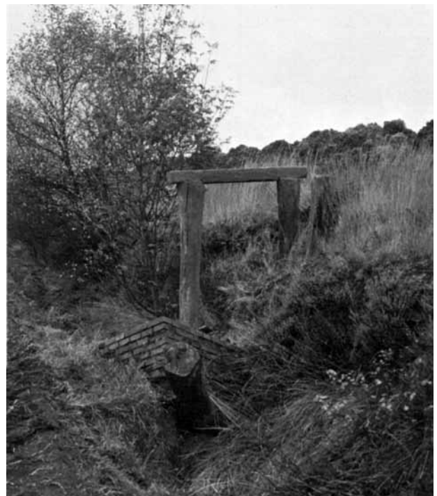
De verdwenen grenspaal 163-II op de virtuele kruising van verlengde Postweg en de landsgrens (bron; Nieuwe Drentse Volksalmanak. Feitelijkheden aan onze oostelijke grens, F.A. Dijck, 1978).

Bij de resolutie van 14 januari 1764 is de grens exact bepaald en door de beide partijen Munster en de Republiek goedgekeurd, aldus Anton Dijck in zijn bijdrage aan de Drentse Volksalmanak in 1978.