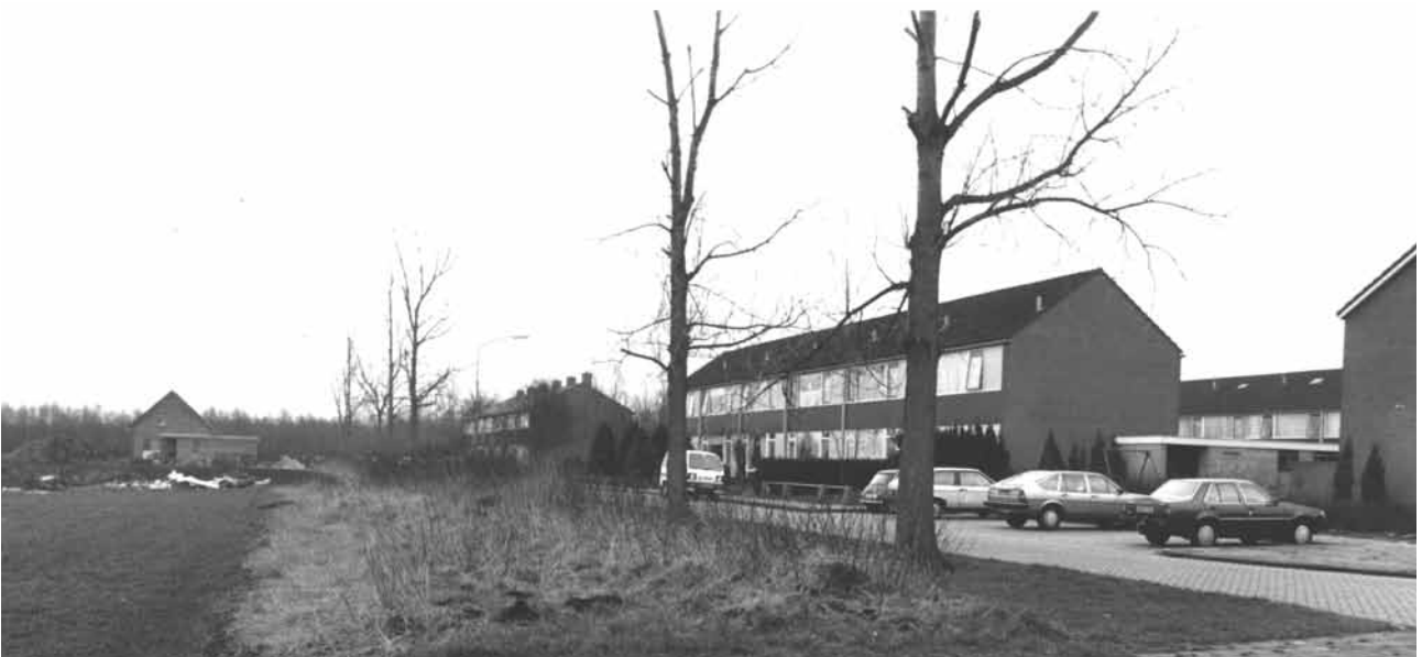
De Posthoorn omstreeks de jaren '80. Het eerste particuliere huis op de hoek Postweg- Posthoorn is inmiddels gebouwd.

Er wordt goed verdiend. Behalve in de productie op de fabrieken en in de bouw, vinden de mensen goede banen in de handel, onderwijs en dienstverlening. Maar ook de zorg trekt de nodige – met name vrouwelijk- personeel. Bewoners willen bouwen.