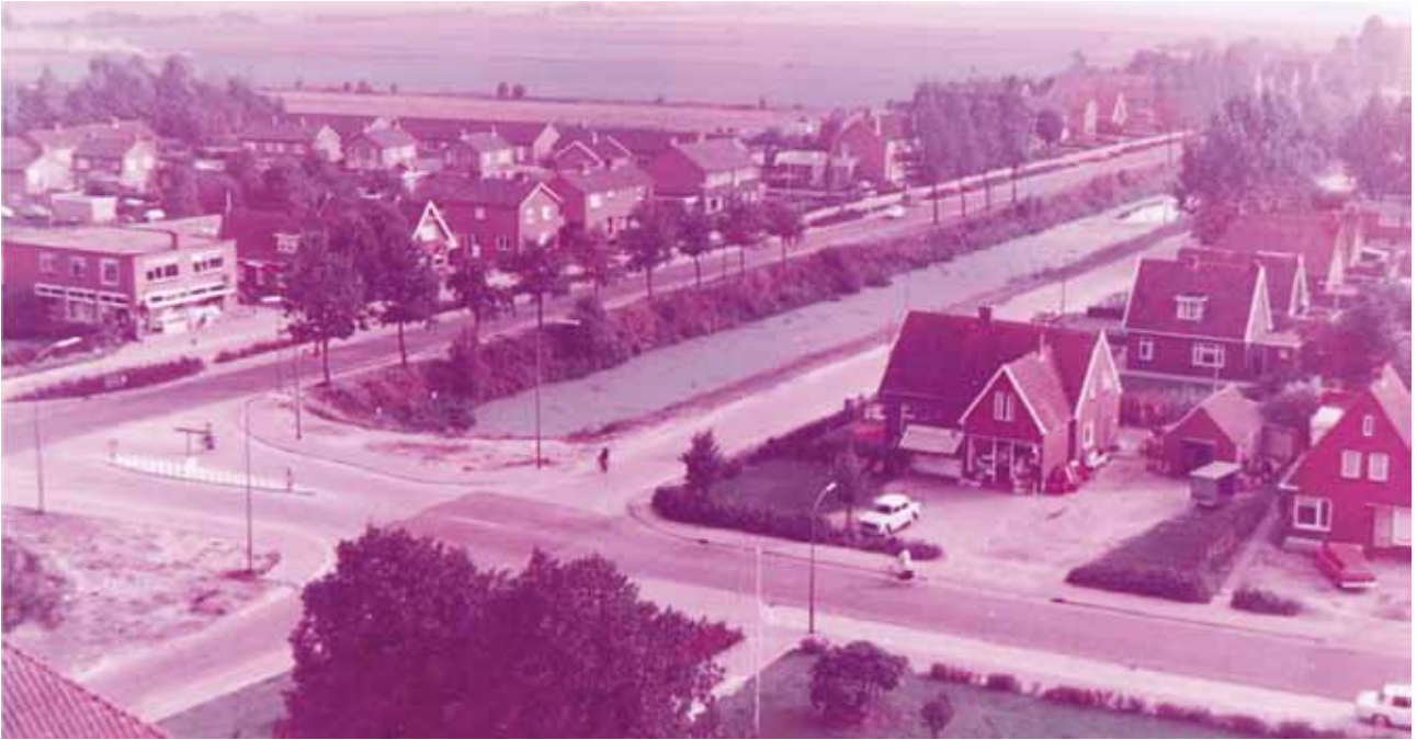
Een foto gemaakt in zuidelijke richting. In de verte de Limietweg-zuid en links vooraan de Jan Berendstraat, rechts groenteboer Bernsen en bakkerij Lukkien.

De eerste vijf en twintig jaar na de Tweede Wereldoorlog komt veel huur-woningbouw tot stand. Na 1960 ontstaat ook de behoefte aan een 'eigen huis'. Veel Bargercompasumer mannen zijn bouwvakkers, werken bij Exel of Linnemann en zij bouwen hun eigen huis. Ook steeds meer vrouwen vinden werk buitenshuis. Alle ruimtes in de kern aan het Verlengde Oosterdiep, Torenstraat, Jan Berendstraat en de Postweg worden 'gedicht' met particuliere huizenbouw.