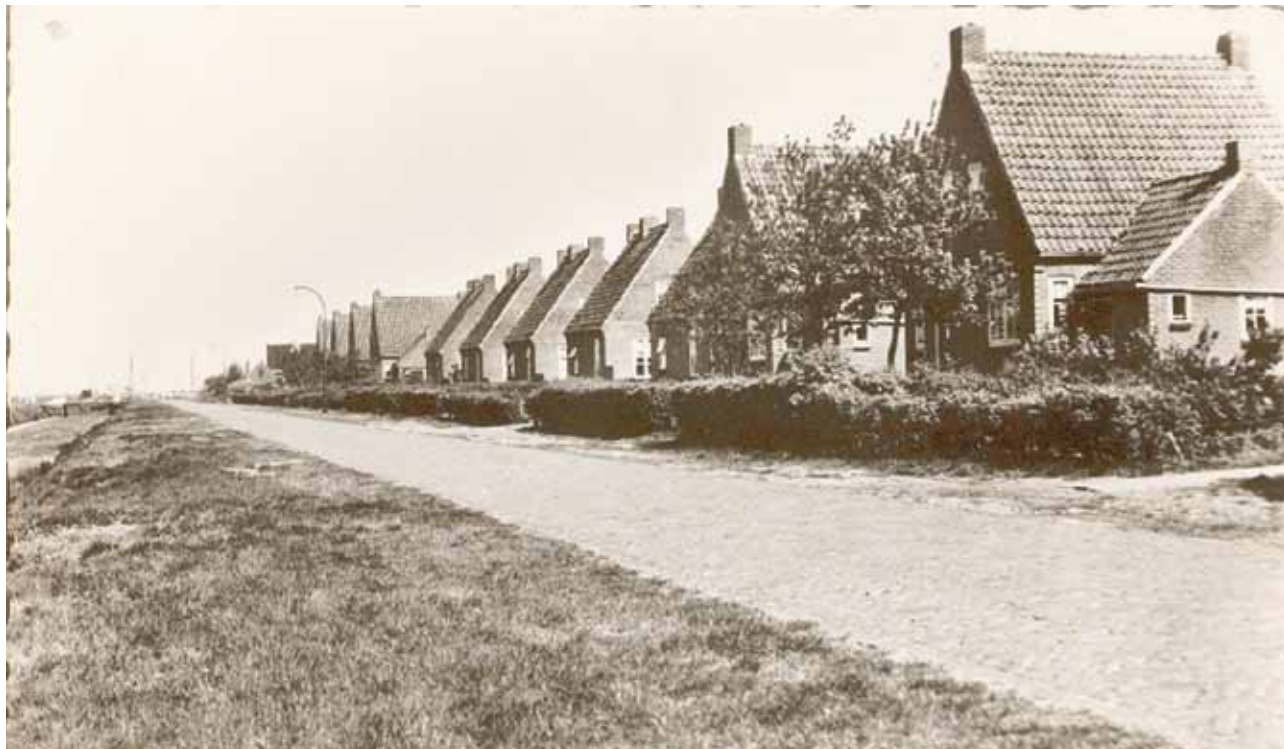
Een winters plaatje van de huizen aan de St. Josefstraat in de jaren rond 1950. Wijk 26, 'de Josefwieke' is bevroren. Vooraan ligt een vonder over het kanaal.

De arbeidershuisjes op het bovenveen en in het veld worden opgeruimd. Hier zijn ook veel krotten bij. Al voor de Tweede Wereldoorlog bouwt de gemeente groepjes huurhuizen, zoals aan de Limietweg. In de oorlog wordt niet gebouwd. De gemeente is verplicht de krotten op te ruimen en zijn bevolking goede woningen aan te bieden (Roest, 1992).