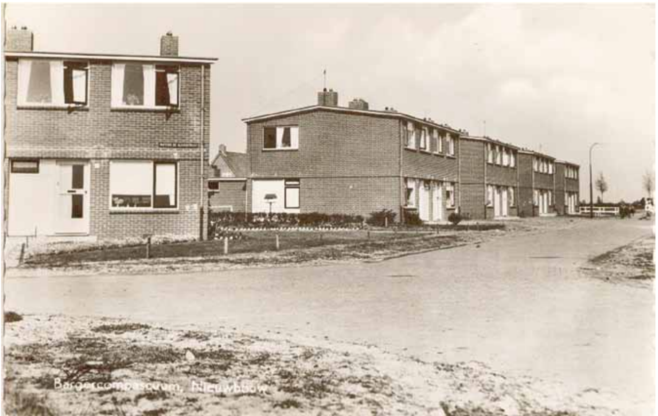
De woningbouw van de Pastoor de Klaverstraat en de Pastoor Vroomstraat, gebouwd in 1957.