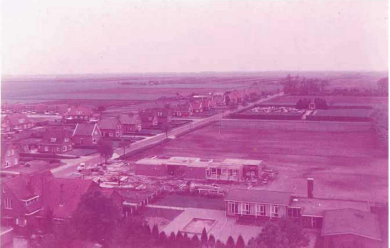
Zicht op de Postweg in westelijke richting. Deze foto moet van 1967 zijn, want het Kruisgebouw is in aanbouw. In de verte op de plaats waar later de Kwakel ontstaat, lijkt men nog met verving bezig te zijn. Het land tussen het kerkhof en het eikenbosje van Wilken behoort nog niet tot het Veenmuseum.