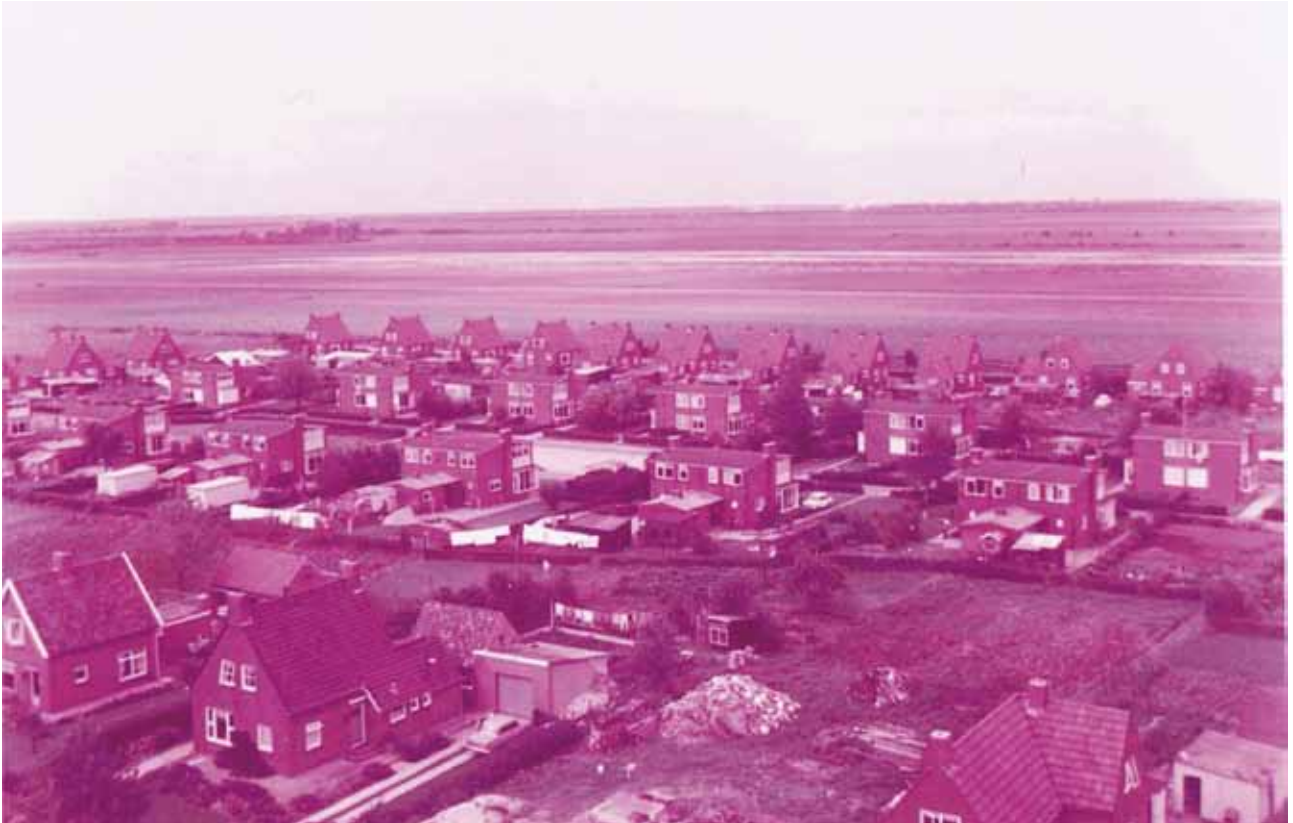
Deze foto dateert uit 1970. Vooraan is de Torenstraat, middenin is Het Spaan, gevolgd door de St. Josefstraat. Links zijn nog twee huizen van de Stikker te zien. In de verte, links is de Berkenrode.