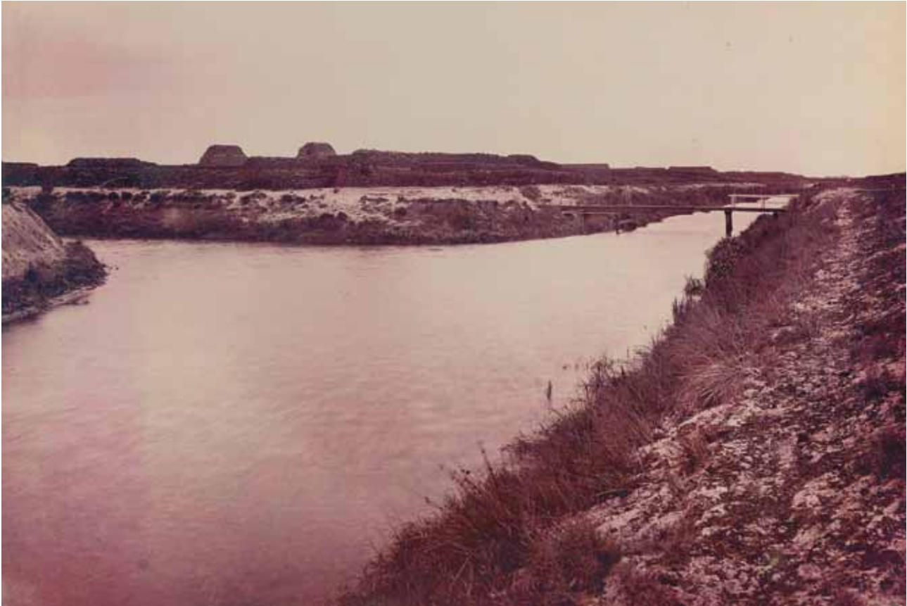
De vervening is volop bezig. Turfbulten staan te wachten op transport. Kanalen, zijwijken en kale, lege vlaktes bepalen het beeld van het gebied ten oosten van Emmen.