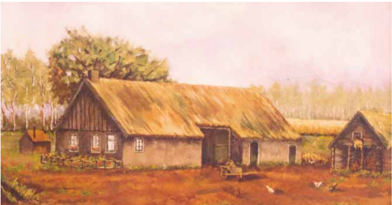
De boerderij van Geert Lubbers aan de Schoolweg-zuid. Willem Arling noemt dit Centrum-zuid. Het huis wordt weergegeven onder Centrum-zuid nummer 10 (bron; mw A. Schulte).

De streek wordt verdeeld in 'plaatsen' van 200 meter breed met een lengte, bepaald door de afstand Runde-Breede Sloot. Zo ontstaan er 32 plaatsen, die elk een nummer krijgen van 11 in het noorden tot 43 in het zuiden. De plaatsen worden verdeeld over 4 kleuren, verspreid door het hele gebied, zodat elke kleur een oppervlakte vertegenwoordigt van 335 hectare. Vervolgens wordt er geloot om de kleuren. Gratama krijgt geel, Tonckens wit, Hiddingh groen en van Holthe tot Echten de bruine kleur.