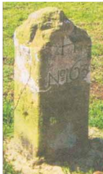
Grenssteen 163 staat aan de grens tussen de beide dorpen Hebelmeer en Bargercompascuum. De H staat voor Hannover (bron; Knapzakroute K 25 Bargercompascuum- Hebelmeer; 2009).

Binnen het Duitse rijk woedde onenigheid tussen het grote Pruisen, dat onder leiding van minister-president Otto von Bismarck alle Duitse statjes wilde samenvoegen tot één groot mid-Europees blok en Oostenrijk, dat aparte landen voorstond. In deze Pruisisch- Oostenrijkse oorlog was Hannover lang neutraal, maar koos uiteindelijk voor de Oostenrijkers. De Oostenrijkers verliezen de strijd tegen het Pruisische leger in de slag van Langensalza in 1866. Hannover wordt geannexeerd en omgevormd tot een provincie van het keizerrijk Pruisen. Pruisen verplicht jonge mannen drie jaar in dienst te gaan. Dit is voor veel mannen, wonende in de Duitse grensplaatsen aanleiding om de vlucht te nemen naar elders. Velen trokken het Nederlands grensgebied binnen en dit leidde tot het ontstaan van vele dorpen ten oosten van Emmen in de Zuidoosthoek van Drenthe (zie ook bijlage 1, De trek van Duitsers in 1860-1880 naar Nederland).