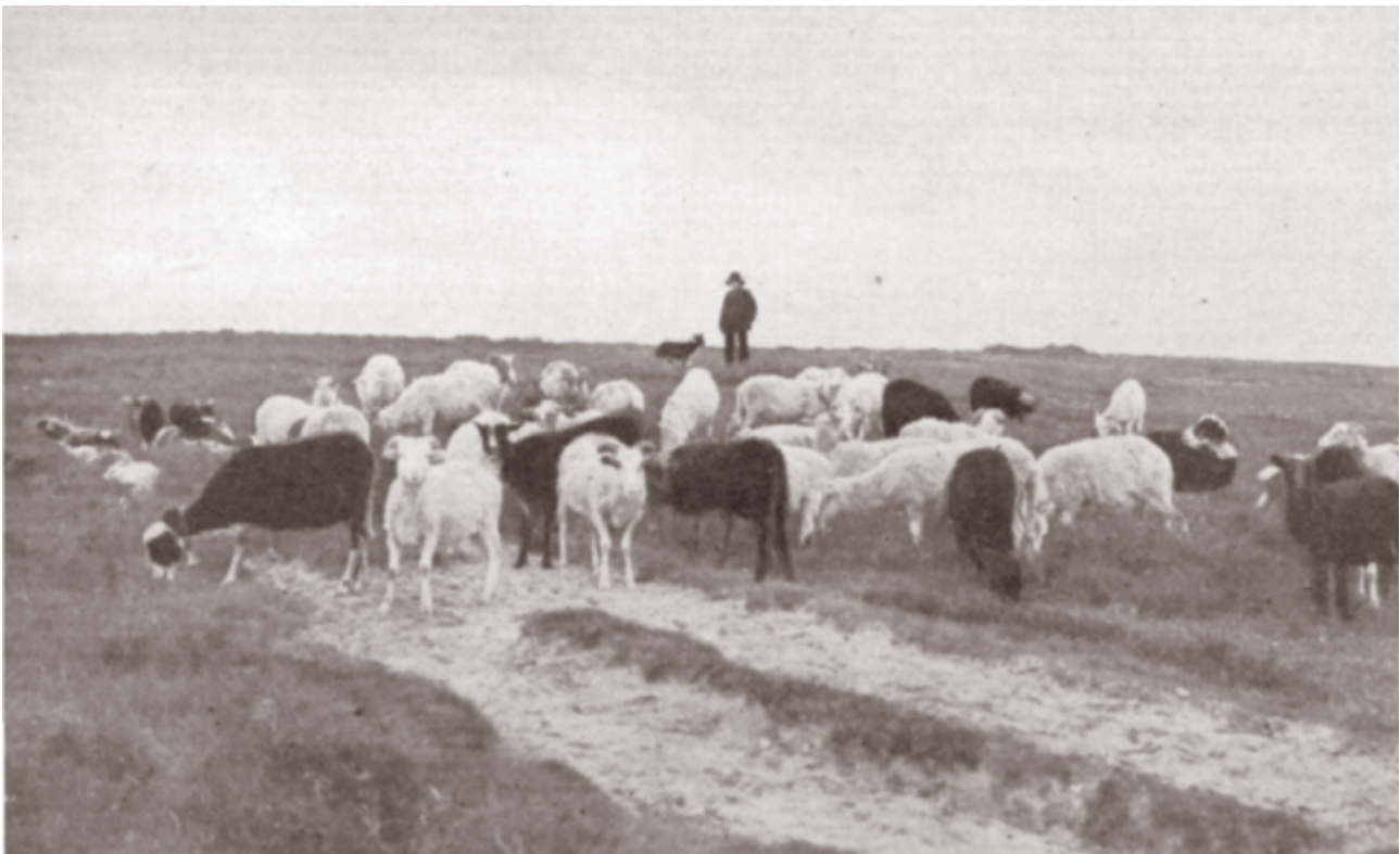
De herder met hond en schapen in het veld (bron; Emmen en Zuidoost Drenthe, Dr. J. Visscher, 1940).

De markegenoten van de Hondsrug hebben het moerasgebied, dat zich naar het oosten toe uitstrekt als weidegebied in gebruik. De kudde met herder en hond trekt elke dag over de heide.