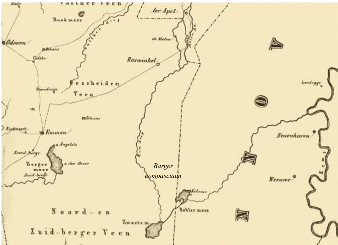
Kaart 2. Het Bourtanger Moeras met links de Drentse dorpen en rechts de Duitse dorpen, centraal ligt het Zwarte Meer en het Rundiep. Ingetekend is de plaats van het latere Bargercompascuum.

Inwoners van de aangrenzende zanddorpen, Noord –en Zuid Barge, Emmen, Westenesch, Weerdinge en Roswinkel in Nederland en Langen, Haren, Wesuwe en Versen in Duitsland kennen de streek beter. Ze laten er hun schapen grazen, kappen hout om huizen en schuren van te bouwen. Ook graven ze turf voor eigen gebruik. Voor de dorpelingen is het moeras dan wel begaanbaar, maar wonen gebeurt op de veilige hoogten van de Hondsrug in Nederland en op de zandboorden van de oevers van de Ems in Duitsland.